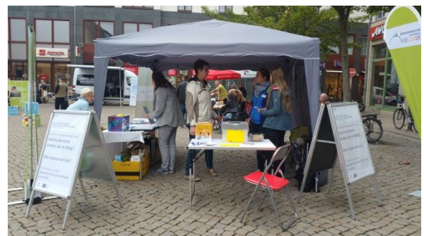
Der Stand des Örtlichen Teilhabemanagements und des Aktionsbündnisses „Landkreis Harz inklusiv“ auf dem Aktionstag für Barrierefreiheit.

Um mit den Menschen im Landkreis ins Gespräch zu kommen und von ihren Erfahrungen und Problemen bei der Teilhabe zu erfahren, führten wir am 14.09.2018 beim 9. Aktionstag für Barrierefreiheit eine Umfrage durch. Welche Antworten wir auf die Frage „Welche Barrieren erleben Sie im Alltag?“ erhielten, können Sie hier nachlesen.