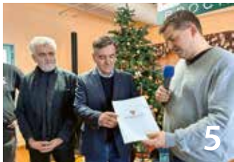
Bund und Land fördern Heinesaal auf dem Brocken