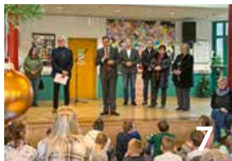
Energetische Sanierung kann dank Förderung anlaufen