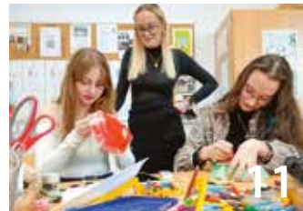
Vollzeitbildungsgänge an Berufsbildenden Schulen