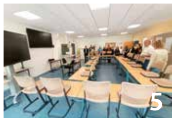
DigitalPakt Schule ist erfolgreich abgeschlossen