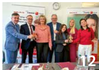
Kooperation sorgt für zusätzliche Fachkräfte