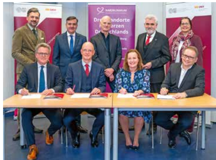
Vertreter aus Landespolitik, kommunaler Ebene, Wissenschaft und Klinikleitungen bei der Unterzeichnung der Kooperationsvereinbarung zwischen Universitätsmedizin Halle und Harzkllinikum.