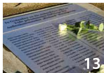
Gedenkort erinnert an Todesopfer

Herausgeber Landkreis Harz Der Landrat Friedrich-Ebert-Straße 2 38820 Halberstadt Redaktion/Bezug Pressestelle des Landkreises Harz Friedrich-Ebert-Straße 42 38820 Halberstadt Telefon: 03941 5970-4208 E-Mail: pressestelle@kreis-hz.de