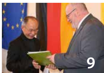
Einbürgerungen werden 2026 fortgesetzt