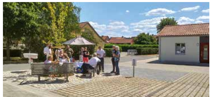
Neugestaltung des Platzes an der Hausarztpraxis am Langenkamp in Osterwieck, 2025/26, ELER