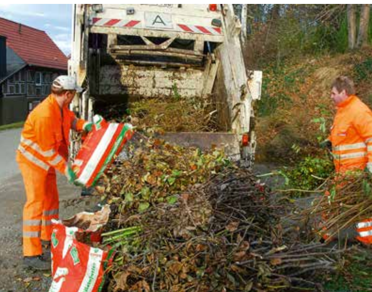
Mitarbeiter der Abfallwirtschaft Nordharz GmbH sammeln den bereitgelegten Baum- und Strauchschnitt ein.

Landkreis. Noch bis zum 10. April werden Gartenabfälle wie Baum- und Strauchschnitt, Rasenschnitt oder Laub von der Entsorgungswirtschaft des Landkreises Harz AoR (enwi) entsorgt.