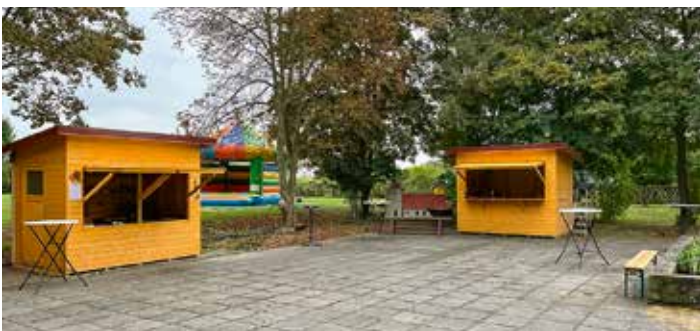
Elektrifizierung und Neugestaltung Außenanlage Heimatstube Schlanstedt, 2025 über ELER „Lebensqualität in den Städten und Dörfern“.