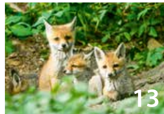
Richtiger Umgang mit jungen Wildtieren