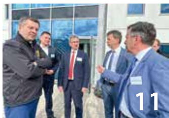
Harzer Gesundheit für die Welt