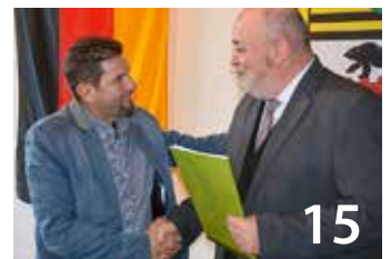
Einbürgerungsurkunden für 38 neue Kreisbürger

Herausgeber Landkreis Harz Der Landrat Friedrich-Ebert-Straße 2 38820 Halberstadt