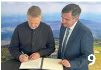
Brockenpachtvertrag ist unterzeichnet