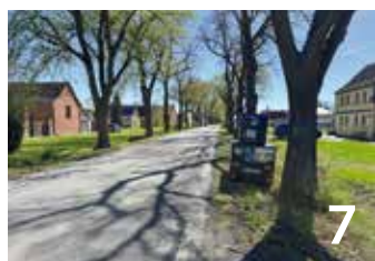
7 Blitzer nach fast 10 Jahren wieder zurück