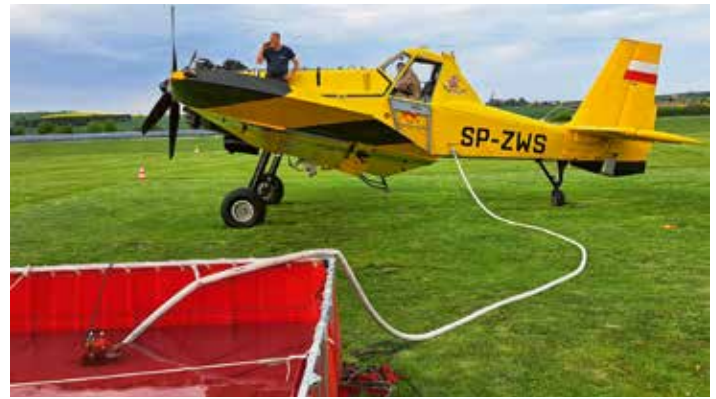
Hexe 1 kam am 3. Mai zum ersten Mal zum Einsatz.

Die Hexe 1 wurde gegen 17.45 Uhr nachgeordert und für sechs Abwürfe von der Freiwilligen Feuerwehr Ballenstedt auf dem Flugplatz Ballenstedt mit Wasser befüllt.