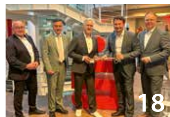
18 Neuerungen bei der Harzsparkasse

Herausgeber Landkreis Harz Der Landrat Friedrich-Ebert-Straße 2 38820 Halberstadt