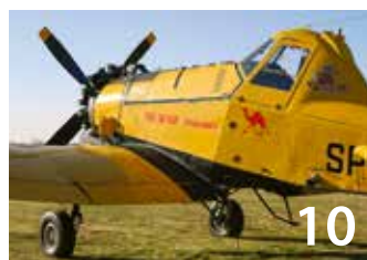
10 Hexe 1 startete zum ersten Einsatz