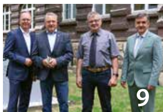
9 Harzfest „Oben im Harz unter Freunden“